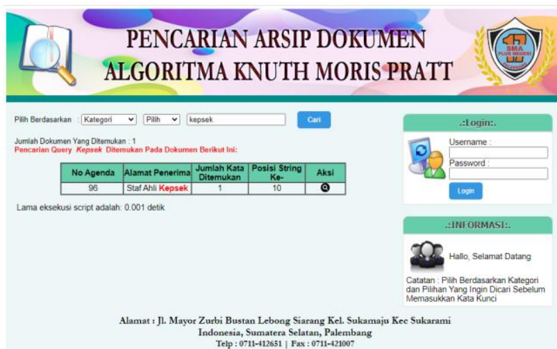
Gambar 2. Antarmuka Pencarian Arsip Dokumen Berdasarkan Surat Keluar

Antar muka pencarian arsip dokumen berdasarkan kategori surat masuk dan alamat pengirim dengan pencarian "Pertamina" ditemukan hasil pencarian sebanyak 1 dokumen dalam posisi string ke-12 dengan waktu 0.001 detik. Pada kata "Pertamina" didalam alamat pengirim terdapat bold berwarna merah yang menandakan posisi kata yang ditemukan oleh KMP. Adapun antar muka pencarian arsip dokumen berdasarkan kategori surat masuk dan alamat pengirim dapat dilihat pada gambar 3.