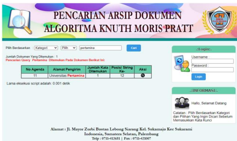
Gambar 3. Antarmuka Pencarian Arsip Dokumen Berdasarkan Surat Masuk

Antar muka pencarian arsip dokumen berdasarkan kategori surat masuk dan alamat pengirim dengan pencarian "Pertamina" ditemukan hasil pencarian sebanyak 1 dokumen dalam posisi string ke-12 dengan waktu 0.001 detik. Pada kata "Pertamina" didalam alamat pengirim terdapat bold berwarna merah yang menandakan posisi kata yang ditemukan oleh KMP. Adapun antar muka pencarian arsip dokumen berdasarkan kategori surat masuk dan alamat pengirim dapat dilihat pada gambar 3.